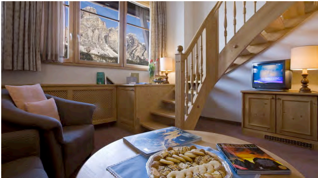
Die Mansardensuite des Posta Zirm Hotels

Das Posta Zirm Hotel besteht aus dem altherwürdigen Haupthaus und einem geschmackvollen Neubau, der mit dem Haupthaus intern verbunden ist. Hier liegen unter anderem auch die Doppelzimmer de luxe, die ein hohes Niveau an Komfort und einen privaten Balkon mit einer grandiosen Sicht zum Berg "Boe" und zur Kirche von Santa Caterina bieten. Ein absolutes Highlight ist die Mansardensuite, die auf zwei Stockwerken offen aufgebaut wurde: Im unteren Stock befinden sich ein großräumiges Wohnzimmer und das Badezimmer, das Schlafzimmer liegt im oberen Bereich. Diese Suite ist vor allem für Familien eine sehr gute Wahl. Die Zimmer zur Bergseite bieten einen wunderschönen Blick auf die Dolomiten und die fantastische Natur von Alta Badia. Insgesamt verfügt das Posta Zirm über 67 Zimmer und Suiten.