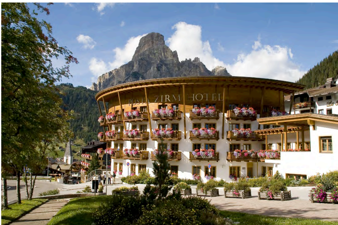
Atemberaubende Bergkulisse: Das Posta Zirm Hotel liegt im Herzen der Dolomiten

Alpenländische Tradition gepaart mit moderner Gastfreundschaft - so präsentiert sich das traditionelle Posta Zirm Hotel in Corvara. Geborgenheit, familiäre Herzlichkeit sowie ein klares und elegantes Ambiente begleiten die Gäste durch ihre Urlaubszeit im Herzen der Dolomiten. Dank der gehobenen Küche, der speziellen Wellness-Philosophie, die fernöstliche und westliche Methoden verbindet, und einer atemberaubende Naturlandschaft wird der Aufenthalt im Posta Zirm Hotel zum Urlaub für die Sinne. Durch die unmittelbare Nähe zum Hauslift Col Alto, ist das Posta Zirm Hotel ein idealer Ausgangspunkt zu den Skipisten, der Sellaronda und zu unzähligen Wanderungen im Sommer. Das Posta Zirm liegt in einem malerischen Bergdorf auf 1568 Meter Höhe und bietet ideale Voraussetzungen, um die Seele baumeln zu lassen und einen glücklichen Urlaub zu verbringen. Rundum das Hotel offenbart sich den Gästen ein Berg-Panorama, indem das Vier-Sterne-Hotel wie eingebettet seinen Platz und seine feste Bestimmung gefunden hat. Wer wieder einmal so richtig zu Ruhe kommen will, ist hier genau richtig aufgehoben. Raus aus der Hektik des Alltags und der Arbeitswelt und rein in den Wohlfühltempel Posta Zirm in Corvara.