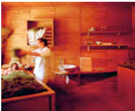
Das wohltuende Heubad....